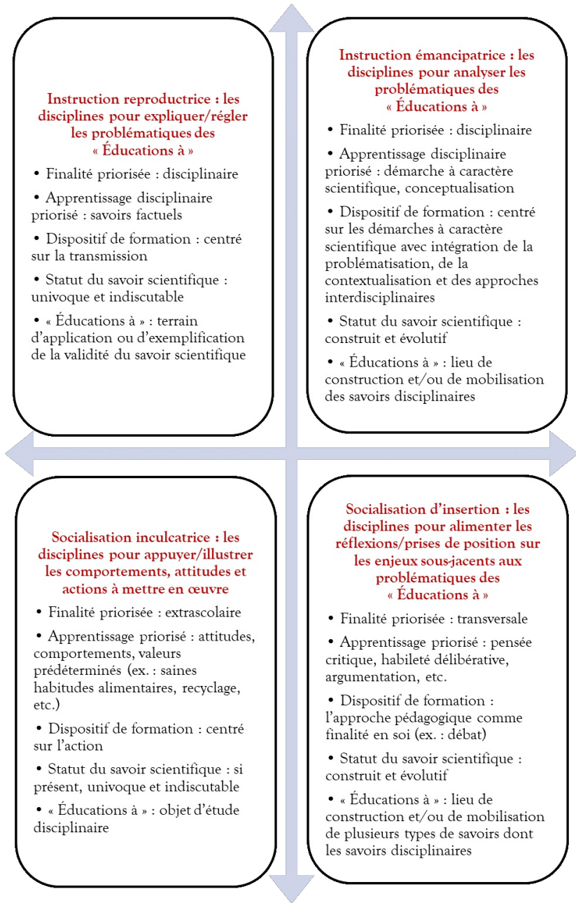
FIGURE 3. Quatre configurations théoriques possibles des relations entre disciplines scolaires et problématiques d'« Éducatifs à »